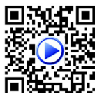
Artigo nº 192606 Escadote Duplo Guarda de proteção Rebatível

Número de degraus inclui a plataforma / topo