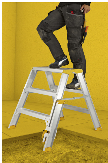
Trabalhos em desnível

Número de degraus inclui a plataforma / topo