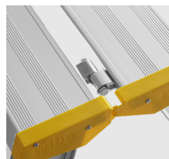
Detalhe das dobradiças