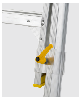
Perna com extensão