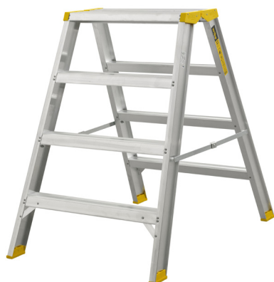
Alumínio Plataforma 250 x 600 mm