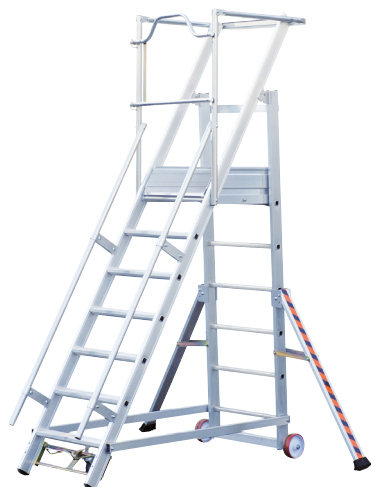
Artigo nº 2271/107 Plataforma p/ utilização frontal