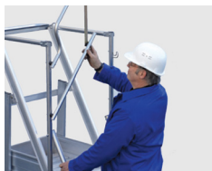
Fecho de segurança