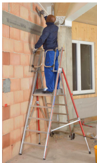
Estabilizador rebatido permite utilização junto a parede