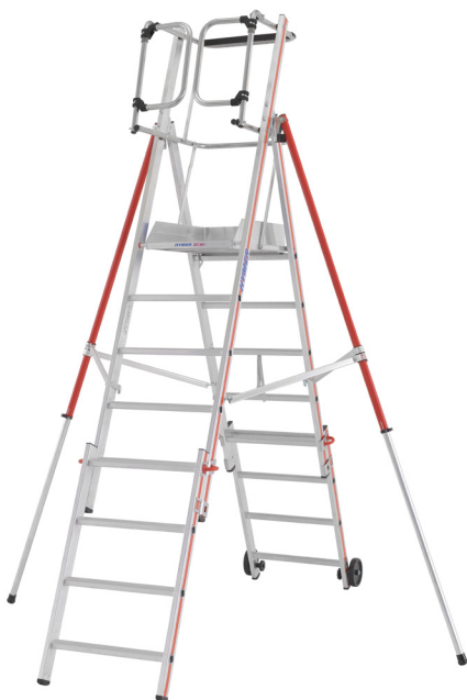
Artigo nº 848408 Portas automáticas na plataforma Estabilizadores telescópicos Inclui kit de extensão