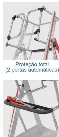
Proteção total (2 portas automáticas)