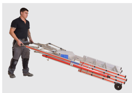
Rebatível e com rodas para transporte