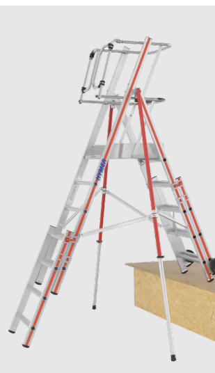
Permite trabalho em desnível