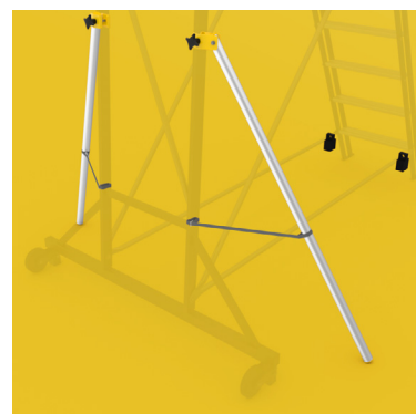
Kit de exterior (acessório), recomendado para o modelo com 12 degraus, Art. nº 806613