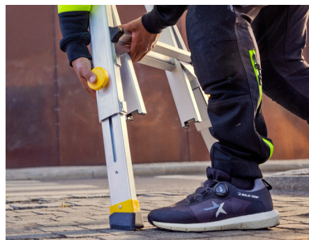
Pernas extensíveis para trabalho em desníveis até 200 mm