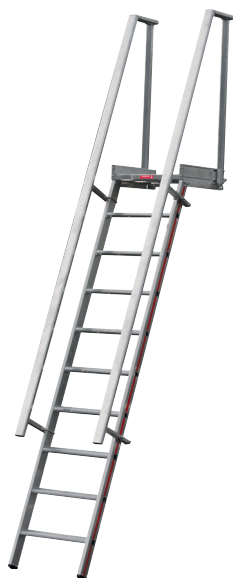
Artigo Nº 806010 2 corrimões

Escada de Acesso com plataforma , com comprimento de 450 mm.