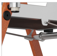
Sistema de segurança