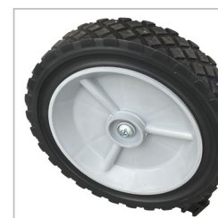
Rodízios (Ø 175 mm) facilitam a deslocação