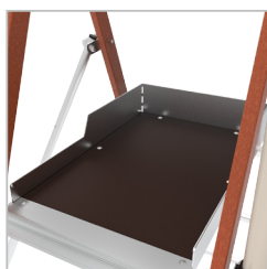
Ampla plataforma, com resguardo