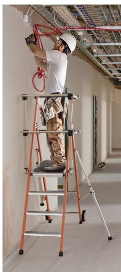
Utilização junto a parede (estabilizador rebatido)