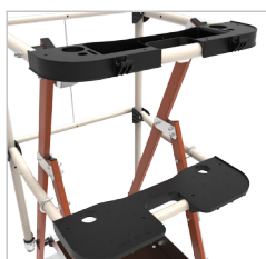
2 porta ferramentas amovíveis