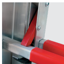
Ganchos de segurança