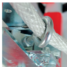
Ilhó soldado para passagem da corda