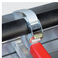
Cintas de retenção