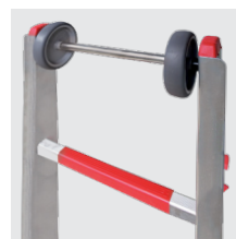
Rodas de rolo no topo