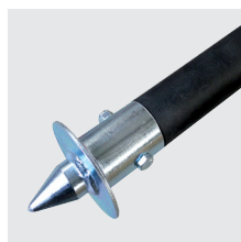
Estabilizador em tubo de alumínio com isolante térmico e espigões em aço