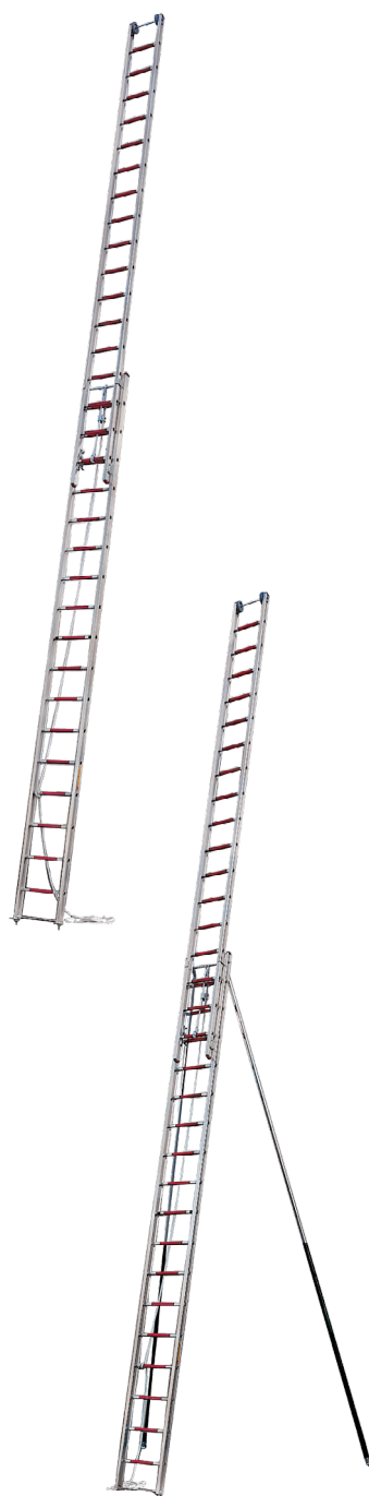
Modelo com estabilizador