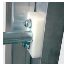
Guias em poliamida