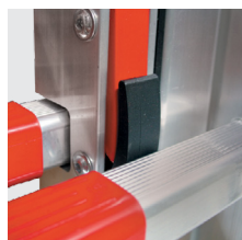
Fecho das secções