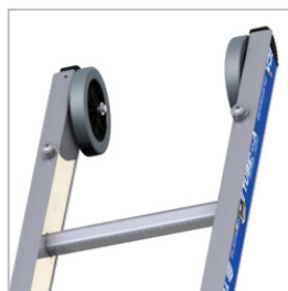
Rodas de topo Ø 125 mm