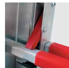
Ganchos de segurança