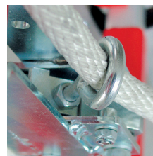
Ilhó soldado para passagem da corda