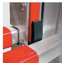
Fecho das secções