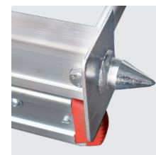
Espigão em aço no perfil da escada, junto à base