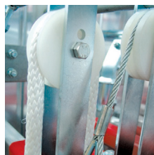
Roldana com corda