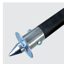
Estabilizador em tubo de alumínio com isolante térmico e espigões em aço