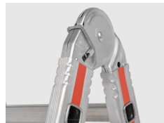
Possui 6 dobradiças