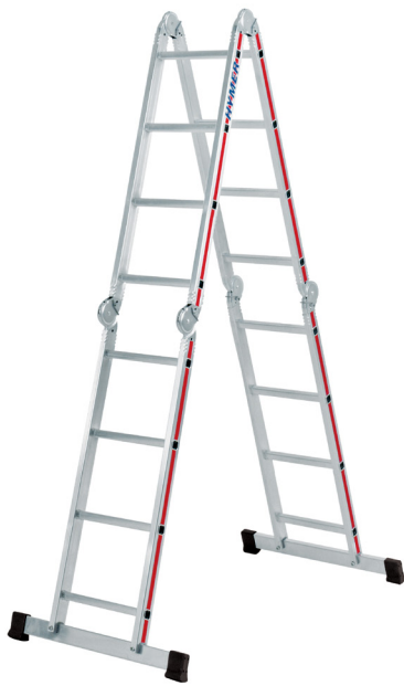
Estabilizadores incluídos 6 dobradiças em aço

As dobradiças devem ser limpas e lubrificadas regularmente.