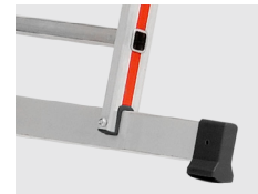
Inclui 2 estabilizadores