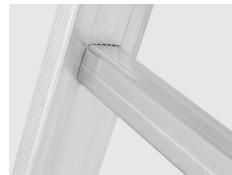
Degraus com 30 mm